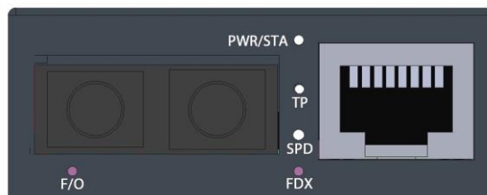
図 1. 2芯ファイバタイプの前面パネル