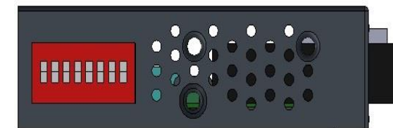
図 4. 右側面パネル