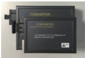
本体サイズ：W 51×D 74×h 20mm