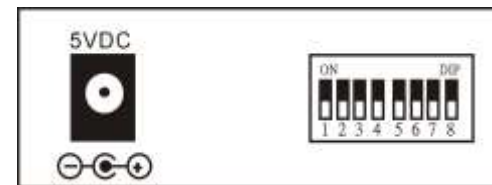
図 3. 後面パネル