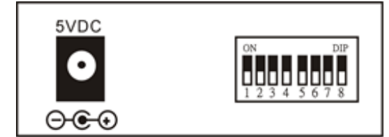
図 3. 後面パネル